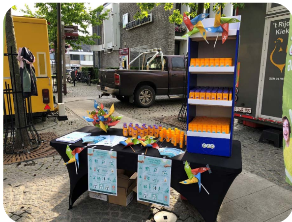
Marktactie Warme Dagen in Lanaken 2024

Maar welke impact zal hitte hebben op onze provincie in de toekomst? Hoe ziet zo'n preventief gezondheidsbeleid rond hitte er uit? De medisch milieukundigen van Logo vertellen het je graag aan deze inspiratietafel. Je komt te weten hoe je met een 'lokaal gezondheidsplan Warme Dagen' je inwoners kan beschermen tegen de gezondheidsrisico's van warmte. Een 'lokaal gezondheidsplan Warme Dagen' bundelt alle acties die de gezondheid van je inwoners beschermen, zowel voor als tijdens warme dagen. En dit verspreid over verschillende diensten binnen jouw gemeente.