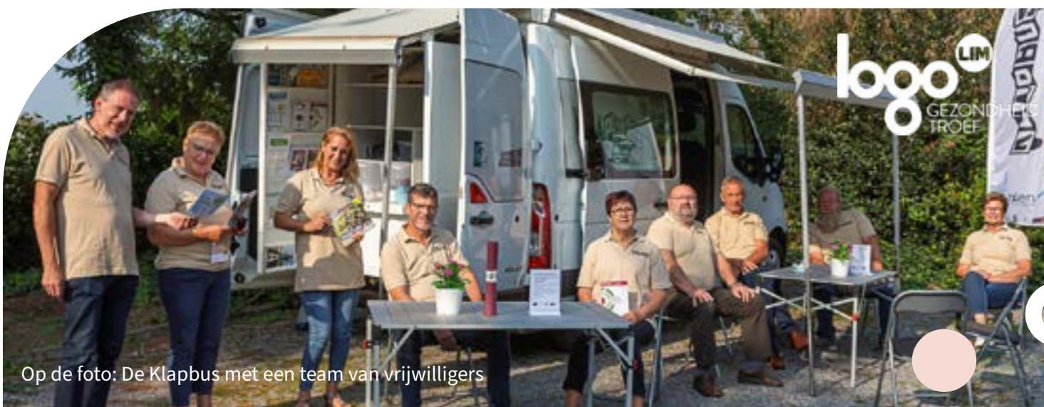
Op de foto: De Klapbus met een team van vrijwilligers

Huisvuil-PMD- en groenzakken kopen, je bloeddruk meten, cultuurcheques, een bib-koffer met uitleenboeken, informatie over eerstelijnsdiensten, een afspraak maken voor gezinshulp, doorverwijzing naar het OCMW,... het kan allemaal.